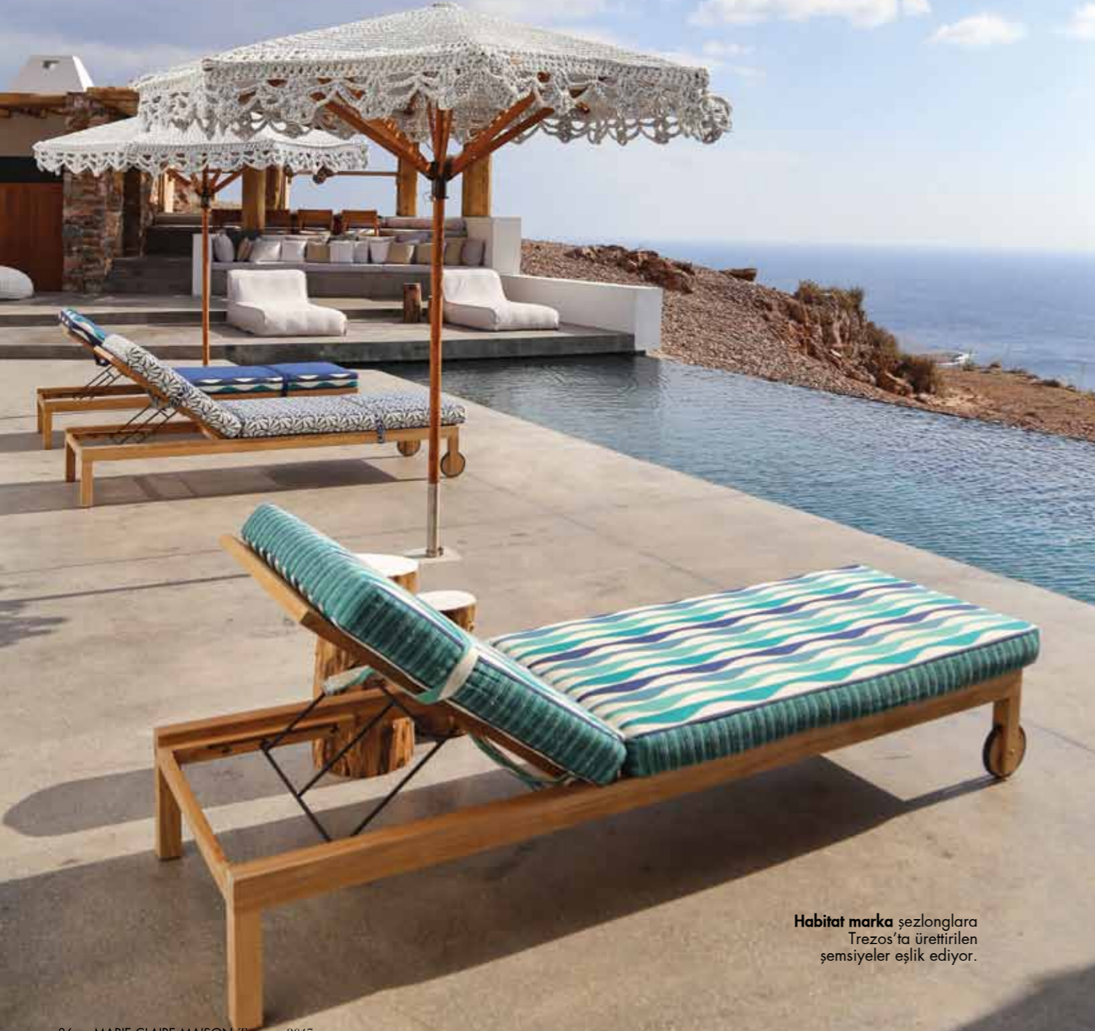
Habitat marka şezlonglara Trezos'ta ürettirilen şemsiyeler eşlik ediyor.